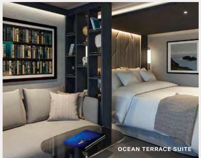
OCEAN TERRACE SUITE