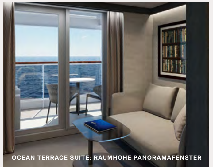
OCEAN TERRACE SUITE: RAUMHOHE PANORAMAFENSTER