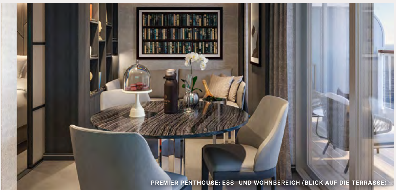
PREMIER PENTHOUSE: ESS- UND WOHNBEREICH (BLICK AUF DIE TERRASSE)