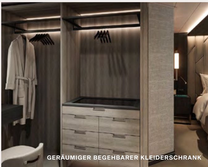
GERÄUMIGER BEGEHBARER KLEIDERSCHRANK