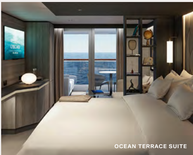
OCEAN TERRACE SUITE