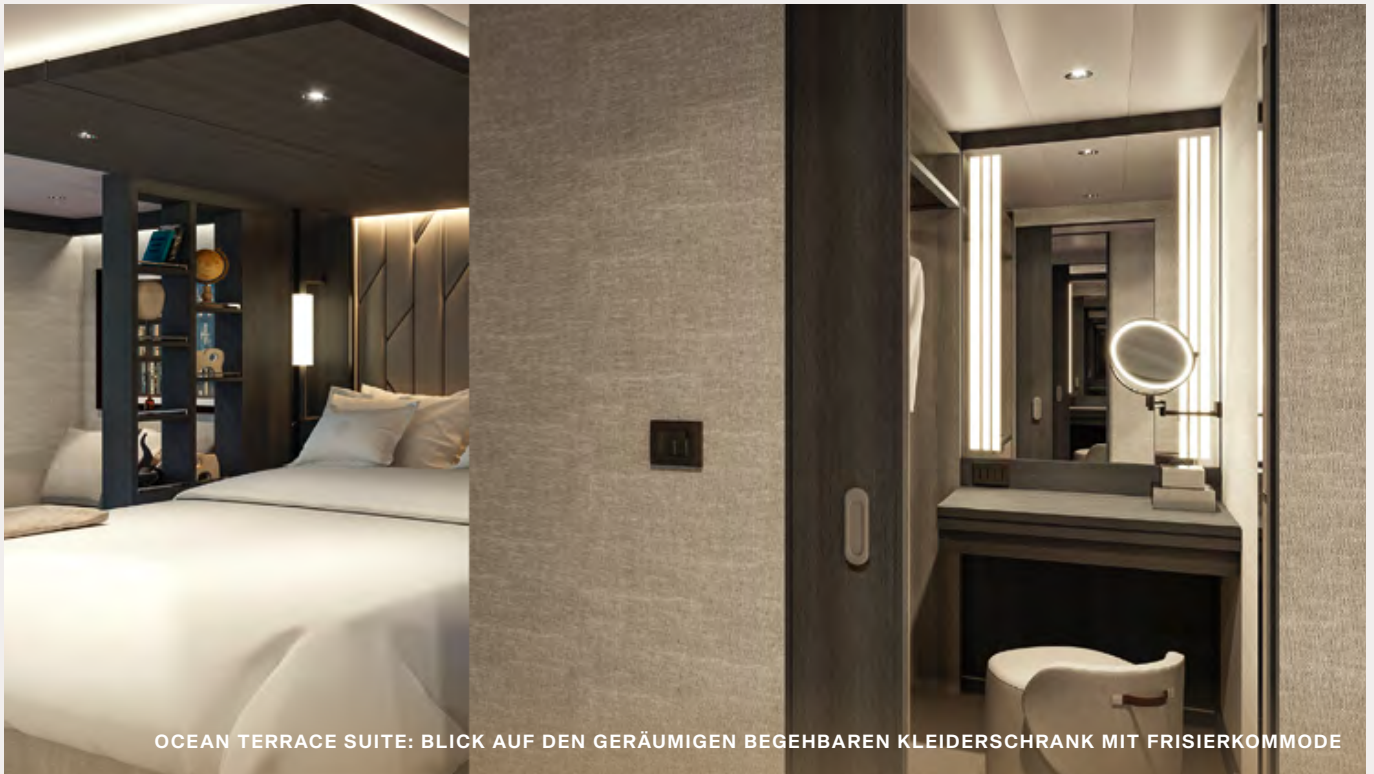
OCEAN TERRACE SUITE: BLICK AUF DEN GERÄUMIGEN BEGEHBAREN KLEIDERSCHRANK MIT FRISIERSCHREIBTISCH